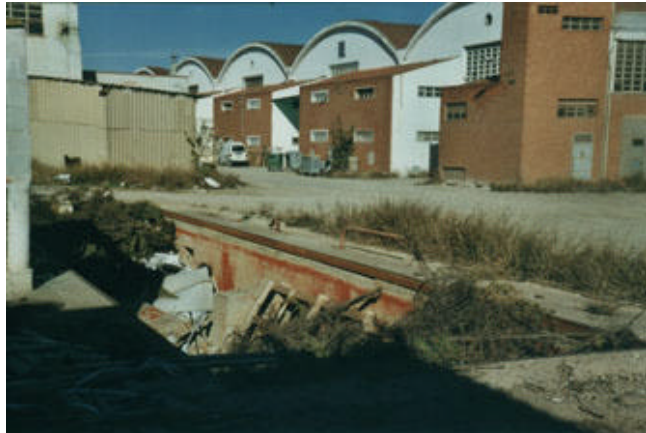
Acumulación desesperada de residuos en un polígono industrial de Zaragoza

En el cuadro adjunto se enumeran los planes de residuos que deberían existir, con el fin de realizar una gestión integrada, si bien se señalan en negrita y subrayados , aquellos que existen en la actualidad.