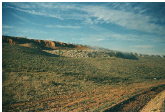
Vertedero incontrolado. Autocombustión

Prevención, gestión y tratamiento de residuos son las tres líneas fundamentales que determinan la estructura de las jornadas, de los talleres y seminarios que se realizan, y hemos de apuntar, ya en los inicios de este artículo, que UGT a nivel Confederal, en 1997, elaboró un Manifiesto sobre la Política de Gestión de los Residuos que denominado "Por la Prevención y la Eficacia en la Gestión de los Residuos" que perfila y determina muchas de las conclusiones del trabajo que UGT-Aragón está realizando en la elaboración de propuesta para una Estrategia Aragonesa de Residuos.