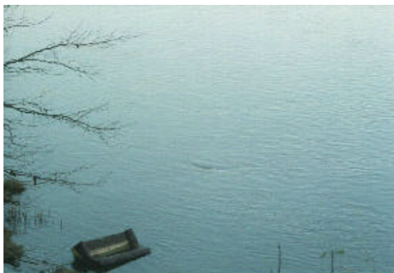
Vertido en el Ebro en detalle

Diferentes fotografías realizadas por compañeros de UGT-Aragón, nos muestran una pequeña parte de la situación: un sofá en el Ebro, un vertedero incontrolado ardiendo, vertidos industriales no peligrosos acumulados sin solución, y así un largo etcétera de ejemplos, que todos conocemos.