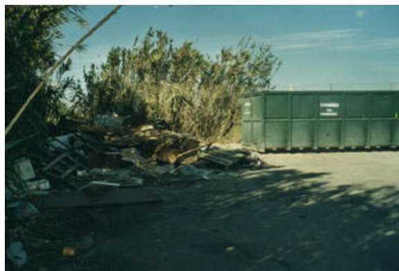
Vertido incontrolado de residuos en un polígono industrial de Zaragoza